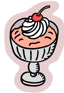
Sữa Chua (Ya-ua)